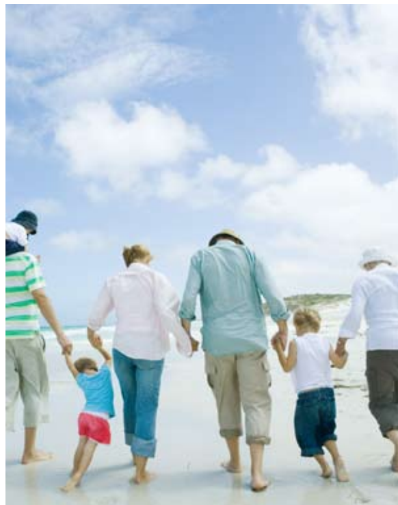
Bli helt försäkrad oavsett ålder och på alla sorters resor.

Låt inte det hindra dig. Reseförsäkring Smart låter dig resa ända t o m vecka 32. De flesta andra försäkringsbolag vill att du ska stanna hemma efter vecka 28.